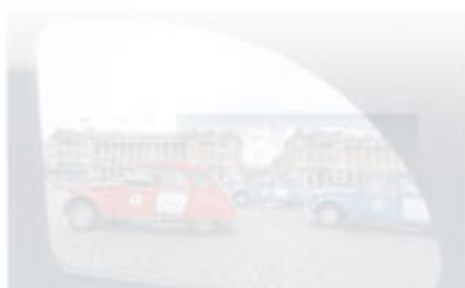
イケメンドライバーとパリ散歩。

● Port de la Bastille 75007 Paris ● ☎ 01-76-64-14-62 ● ☎ 10:00 ~ 22:30 (5奉) ● ☎ 年中無休 ● ☎ ディナーは要予約 ● ☎ ランチ コース€22 ~、ディナーコース€25 ~ ● ☎ カード ● (J)(M)(V) ● www.bistroxpatisseries.com