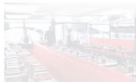
エッフェル塔の影の解でディナー

セーヌ川のブルドック様横に「ル・ブリストル・パリジャン」がオープン。夕日に映えるエッフェル塔を眺めながら、早めの夕食もOK。