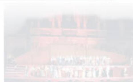
パリのど真ん中で星空オペラを。

● 72 rue Bernard Lamy 75018 Paris ● ☎ 01-58-59-27-82 ● ☎ 9:00 ~ 16:00、20:00 ~ 22:00 ● ☎ 7/14 はパリの休日 ● ☎ 要予約 ● ☎ 30分1名€15 (3人乗り) ~ ● ☎ カード: (J)(M)(V) ● www.Astip.com